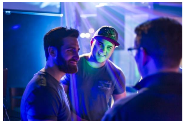
Abbildung 2: ohne Layout

Schritt 2: Sofern Ihr ein personalisiertes Layout wünscht, müsst Ihr euch über folgende Dinge Gedanken machen: