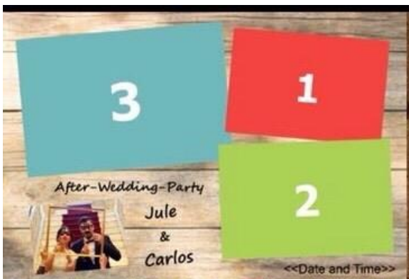
Abbildung 1: personalisiertes Layout

Schritt 1: Zuerst solltet Ihr euch Gedanken darüber machen, ob Ihr ein personalisiertes Layout möchtet, in welches die geschossenen Fotos eingefügt werden, oder ob die Fotobox alle Bilder einfach rahmenlos im Postkartenformat ausdrucken soll.